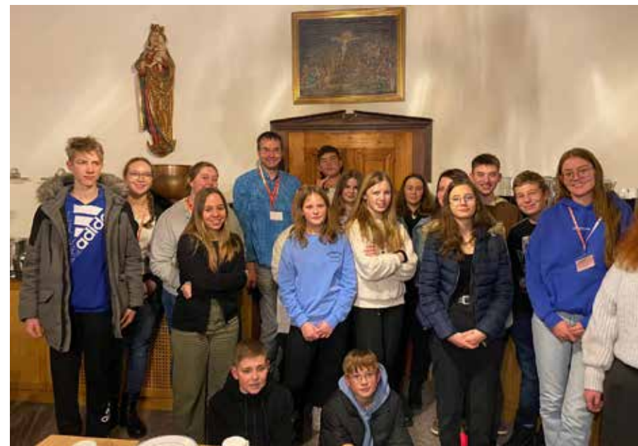
KonfiCastle auf der Burg Wernfels 20. – 23. Januar 2023