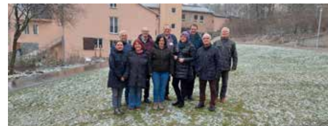
Kirchenvorsteherwochenende Anfang Februar 2023