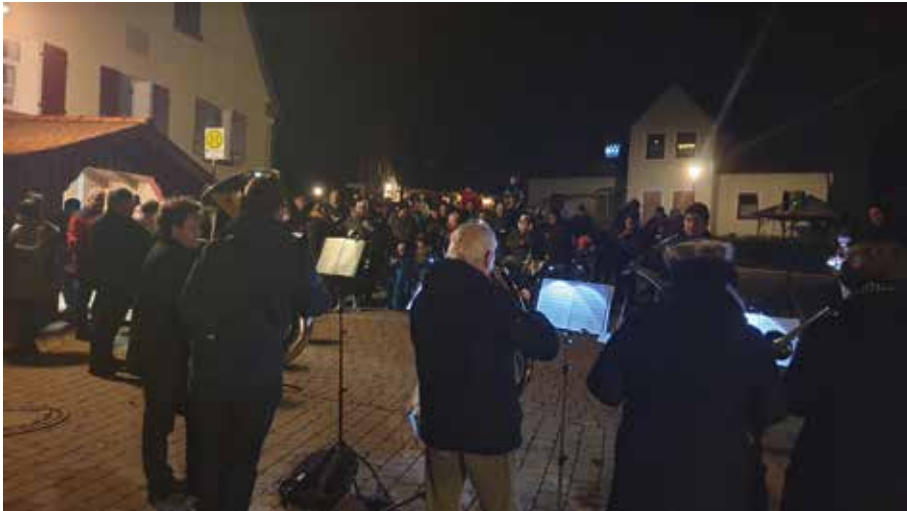
Adventsblasen in Winkelhaid