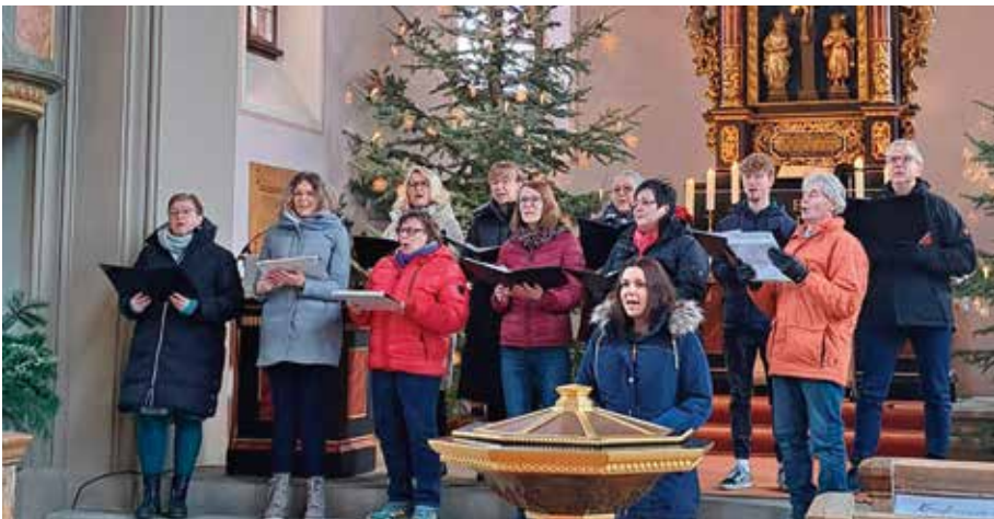
Thalmäs-Singers im Gottesdienst am 2. Sonntag nach Epiphania