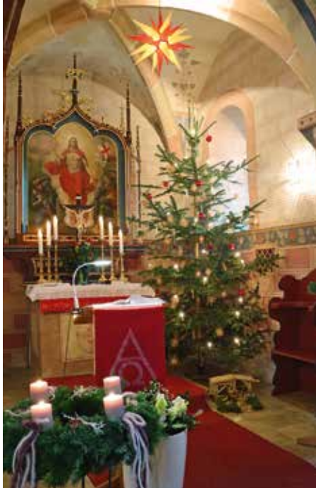
St. Nikolaus, Unterreschenbach, in weihnachtlichem Schmuck