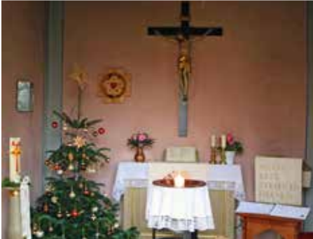
St. Marien, Winkelhaid, in weihnachtlichem Schmuck