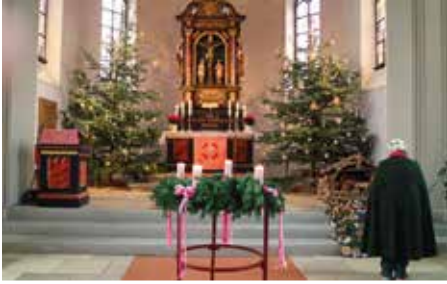
Die Pfarrkirche St. Andreas am 4. Sonntag im Advent – noch rosa gedeckt

Was in der Gemeinde Wassermungenau zu sehen und zu erleben war